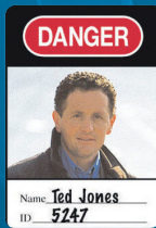
Foto-ID-Etikett für S31, S33, 406 und 410. Etikettenmodell S142.

Verfügbar in Versionen mit Schlüssel nicht abziehbarem Schlüssel (Modell S31) oder abziehbarem Schlüssel (Modell S33) zur Verwendung für Gruppen.